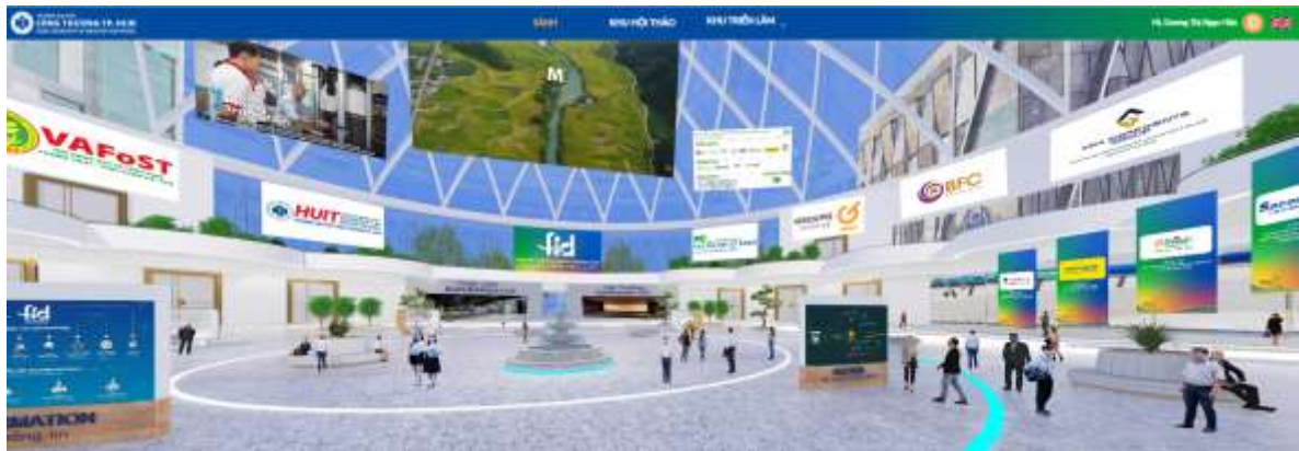
Hình ảnh Sảnh ngay sau khi đăng nhập thành công

Sau khi đăng nhập thành công xuất hiện Sảnh chính, bạn có thể vào “Khu Triển lãm” tại thanh Menu chính – nơi giới thiệu các gian hàng của đối tác và các gian hàng triển lãm của đội thi; “Khu Hội thảo” – nơi diễn ra các sự kiện trực tuyến (Khai mạc, Đào tạo, Bán kết, Chung kết) của Cuộc thi.