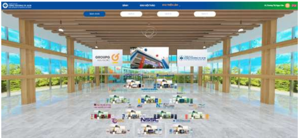
Hình ảnh Khu triển lãm với 4 Sảnh (Sảnh chính, Sảnh A, Sảnh B, Sảnh C)